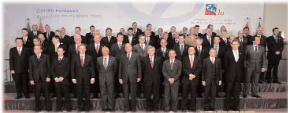
Reuniunea [efilor de stat [i de guvern la Consiliul European din 22 - 23 martie 2005